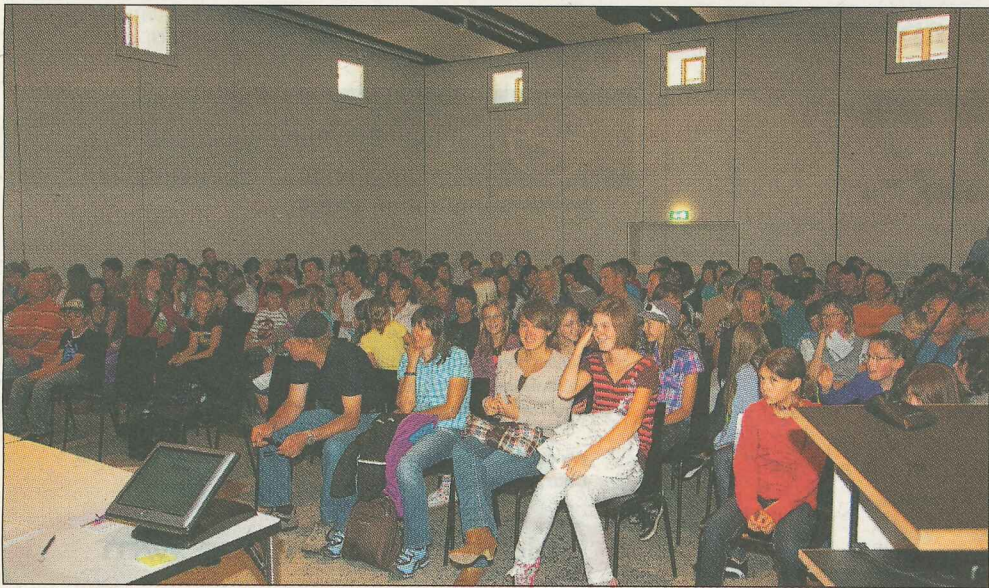
Circa 200 personas han quist on dudi las prelecziuns dals texts vendschaders dal «Pledpierla».