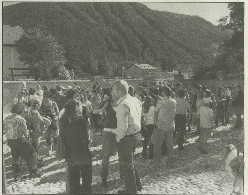
Circa 200 personas han quist on dudi las prelecziuns dals texts vendschaders dal «Pledpierla».