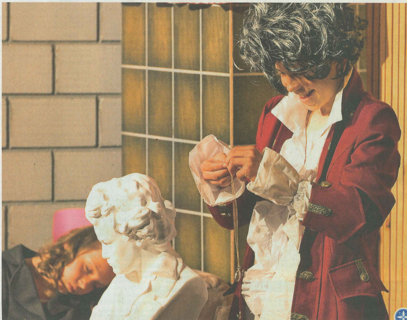
Ils giuvs actuers in acciun. Cun la app «EngadinOnline» as po activer il video zuppo davous la fotografia.

Ulteriuras infurmaziuns sur dal concept da promoziun da talents da la scoula S-chanf as chatta sün www.scoulaepromoziun.com