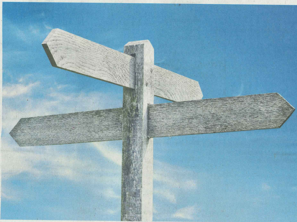
In welche Richtung soll sich die ESTM AG weiterentwickeln? Dies wäre eine Frage, mit der sich der VR beschäftigen sollte – primär geht es nun aber um die Bewältigung der Vergangenheit.

ewisse Anspruchsgruppen im Verwaltungsrat nun gar nicht vereinbar, findet er schade. «Es wäre