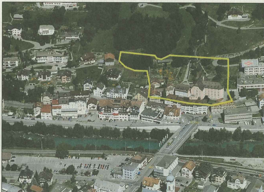
Survista da l'areal per la nova residenza da vegliadetgna e sanadad a Glion. FOTO COM

Pervia da tectonica-is pervia da la turns vegn speziala sin substanza is