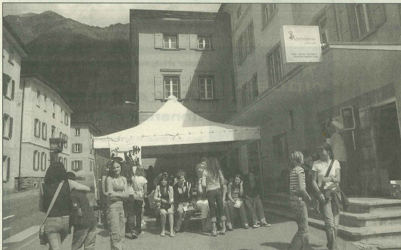
Ils collavuratuors dal Center Ladin a Zernez sun cuntaints cha tuot quista gliued es gnida.