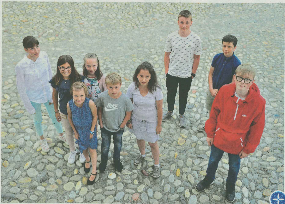
Cun scannar quista fotografia da tuot ils victuors da la concorrenza da scriver rumantsch «pled pierla» cull'app «EngadinOnline» as poja activar il video da la prelecziun a Zernez.